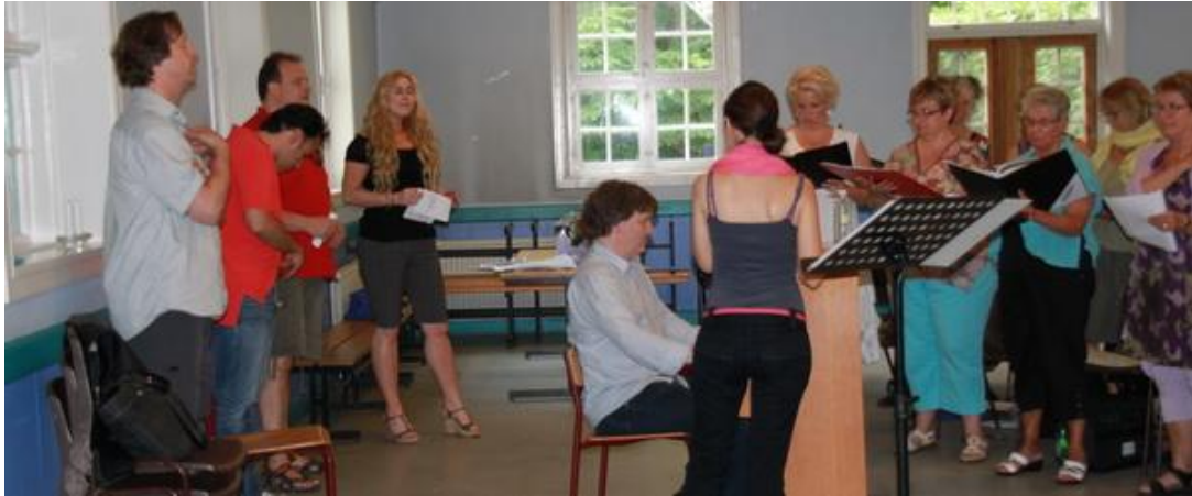
Fra en af prøverne på Roskilde Kro

Søndag den 19. juni gennemførte Kulturhuset Birkelundgaard sit hidtil største arrangement.